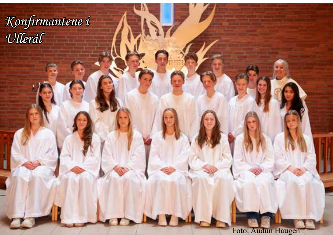
Konfirmantene i Ullerål

Løsningen finner du et annet sted i bladet!